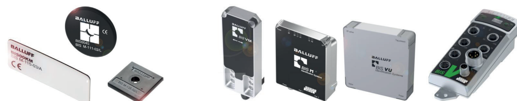
Supports de données en différentes versions pour différents types de réservoir

Grâce à cette transparence complète, vous pouvez optimiser la chaîne de processus – y compris l'approvisionnement du matériel par vos fournisseurs. La saisie de données systématique permet par ailleurs la mise en œuvre de mesures correctives ciblées.