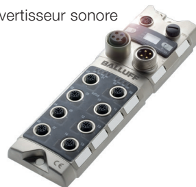
Module réseau destiné à la connexion au système de commande