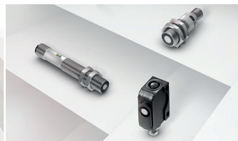
A l'aide du son, les capteurs à ultrasons détectent quasiment tous les objets, indépendamment de la couleur et de la constitution.

Selon le champ d'application, vous pouvez utiliser différentes technologies :