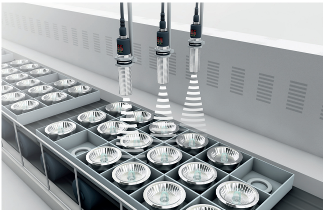
Pendant leur transport, les composants font l'objet d'un contrôle de présence, de position et d'exhaustivité.

En matière d'automatisation, vous disposez de nombreuses possibilités permettant de détecter, d'identifier et de positionner des objets. Vous pouvez utiliser des champs magnétiques, la permittivité – une propriété des matériaux –, la lumière et le son, pour détecter sans contact les métaux, les non-métaux, les aimants, les matières solides et les liquides. Et cela sur des distances entre 1 mm et 60 m.