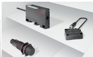
Les capteurs capacitifs détectent la présence ou le niveau de remplissage pour quasiment tous les matériaux et liquides.