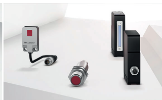
Au moyen de la lumière, les capteurs optoélectroniques détectent quasiment tous les objets.