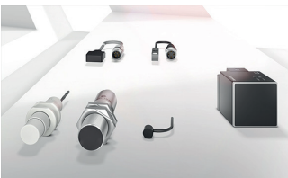
Les capteurs inductifs détectent tous les objets métalliques.

Les capteurs optoélectroniques et à ultrasons sont généralement utilisés pour détecter des objets se trouvant à une grande distance (> 50 mm). Les capteurs inductifs ou capacitifs sont plus adaptés pour les objets situés à une faible distance (< 50 mm) du capteur.