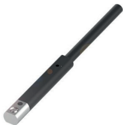
Sensor de campo magnético para ranuras en C para la detección de la posición del pistón en cilindros neumáticos

Un sensor de campo magnético integrado en la ranura detecta el estado de apertura (abierto/cerrado) de una pinza o la posición de un eyector neumático. De esta forma garantizará que los blísters se introduzcan en la caja en la posición exacta o también que se separen las cajas mal empacadas. Los sensores de campo magnético destacan por su diseño compacto y su sencilla instalación.