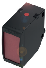
Sensor fotoeléctrico de distancia IO-Link para la medición de distancias

En una unidad hidráulica, por ejemplo, en una máquina herramienta, la presión se puede controlar de forma fiable. Con los sensores de presión IO-Link, usted obtiene lecturas mucho más precisas y se beneficia de una sencilla instalación plug-and-play con cable estándar sin blindaje.