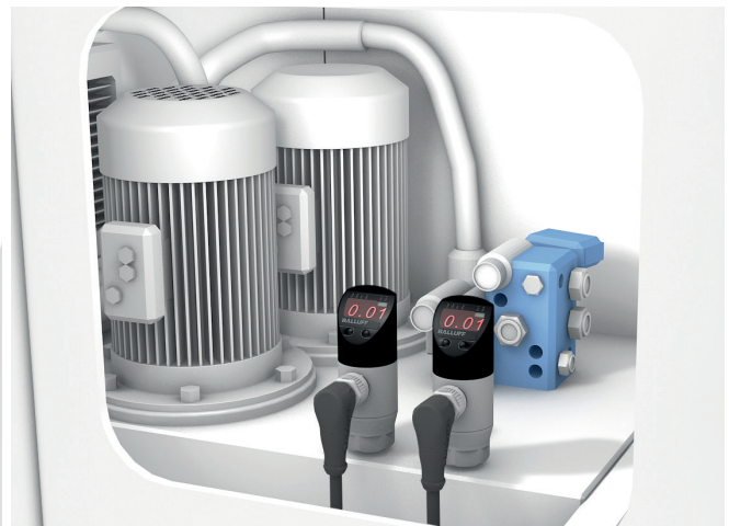
Medición de magnitudes de presión en una unidad hidráulica, por ejemplo, una máquina herramienta, con la ayuda de dos sensores de presión IO-Link

En una estación de bobinado, el diámetro y la ondulación del rollo deben ser monitoreados continuamente. Con los sensores fotoeléctricos de distancia sin contacto usted puede sentirse seguro. Una ventaja adicional: la interfaz IO-Link mejora considerablemente la calidad de la señal en comparación con el producto anterior.