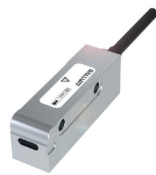
Sistema de medición de posición con codificación magnética IO-Link para la medición de posiciones lineales y rotativas

Contamos con distintos sensores de medición compatibles con IO-Link dependiendo del enfoque de su aplicación: