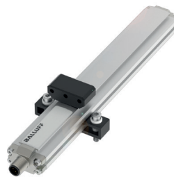
Sistema magnetoestrictivo de medición de posición lineal compatible con IO-Link para la medición de posiciones lineales