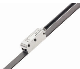
Magnetkodierte Wegmesssystem für die Rundum-Messung (360°), das aus Magnetband und Sensor besteht