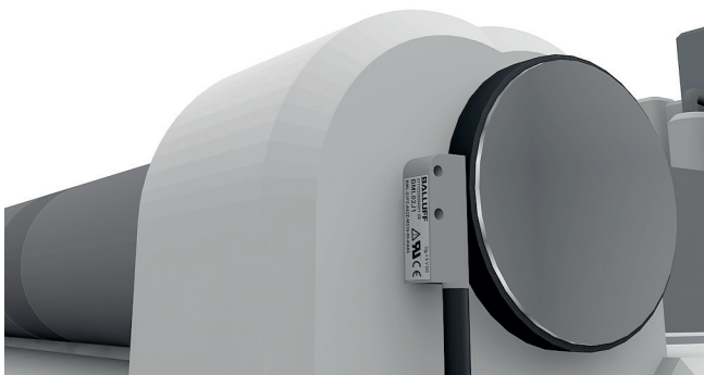
Messung der Objektposition auf dem Laufband einer Schneid-/ Druckmaschine mit magnetkodiertem Wegmesssystem

Sie möchten die Position oder die Drehzahl einer rotativen Achse messen? Beispielsweise am Antrieb, an der Welle oder an bewegten Maschinenteilen? So unterschiedlich wie diese Anwendungen, so unterschiedlich sind die Anforderungen an die messende Sensorik. Daher kommen verschiedene Technologien zum Einsatz: echtzeitfähige und hochauflösende magnetkodierte Wegmesssysteme oder präzise Neigungssensoren.