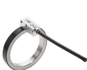
Magnetkodierte Wegmesssystem für unbegrenzte Umdrehungen, das aus Magnetring und Sensor besteht

In einer Parabolrinnen-Anlage wird das Sonnenlicht über Parabolspiegel auf Parabolrinnen gebündelt, wo es als Wärmeenergie gespeichert wird. Um die optimale Energieleistung zu erreichen, muss die Position des Parabolspiegels dem Sonnenstand nachgeführt werden. Neigungssensoren melden die aktuelle Position des Parabolspiegels an die Steuerung, die ihn entsprechend nachjustiert.