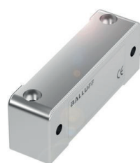
Fluid-basierter Neigungssensor mit guter Auflösung und hoher Genauigkeit über den gesamten Mess- und Temperaturbereich