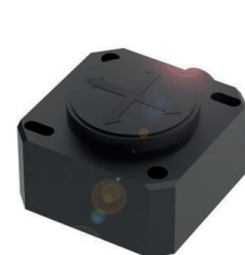
MEMS-basierter Neigungssensor, um von ein oder zwei Achsen zu messen

Ein magnetkodierte Wegmesssystem besteht aus einem magnetisch kodierten Maßkörper und einem Sensor. Der Maßkörper setzt sich aus hintereinander liegenden kodierten Nord- und Südpolen zusammen, die ein magnetisches Feld erzeugen. Der Sensor erkennt dieses Feld und die Polübergänge beim Überfahren des Maßkörpers. Diese Wegmesssysteme sind sehr robust, sehr genau und sehr schnell.