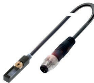
Magnetfeld-Sensor für die T-Nut zur Erfassung der Kolbenposition an Pneumatikzylindern

Der Magnetfeld-Sensor erfasst die Magnetfeld-Stärke eines Dauermagneten. Dies funktioniert auch durch nichtmagnetische Wandungen, z. B. durch einen Aluminium-Zylinder. Wird der Schwellwert (Magnetfeld-Stärke) überschritten, generiert der Sensor ein Schaltsignal. Durch die miniaturisierte Elektronik können Sie diese Sensoren direkt in die C-Nut (3,8 mm) einsetzen. Zusätzlich erhalten Sie Bauformen für andere Nut-Typen, z. B. T-Nut, und für weitere Befestigungsmöglichkeiten.