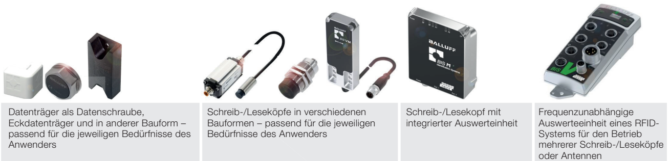
Datenträger als Datenschraube, Eckdatenträger und in anderer Bauform – passend für die jeweiligen Bedürfnisse des Anwenders

Falls ein Fehler erkannt wird, wird ein Fehlercode in den RFID-Tag geschrieben, der von der RFID-Leseeinheit im nächsten Arbeitsschritt identifiziert wird. Das fehlerhafte WIP kann so ausgeschleust und nachbearbeitet werden.